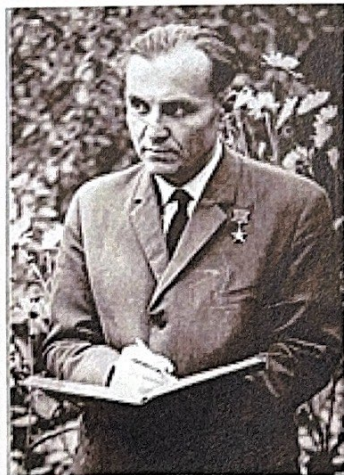
ВАСИЛИЙ АЛЕКСАНДРОВИЧ СУХОМЛИНСКИЙ

Когда думаешь о детском мозге, представляешь нежный цветок розы, на котором дрожит капелька росы. Какая осторожность и нежность нужны, чтобы, сорвав цветок, не уронить каплю