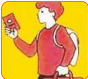
Құжаттарыңызды және нәрселеріңізді алыңыз