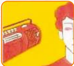
Теледидармен радионы қосып хабарды тыңдыңыз