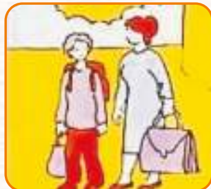
Эвакуациялық пунктке барыңыз