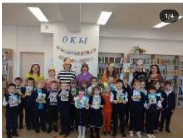
school_4_kokshetau Родители 1 'Б' класса по проекту 'Читающая школа' инсценировали сказку 'Репка' на новый лад. Ребята узнали о...