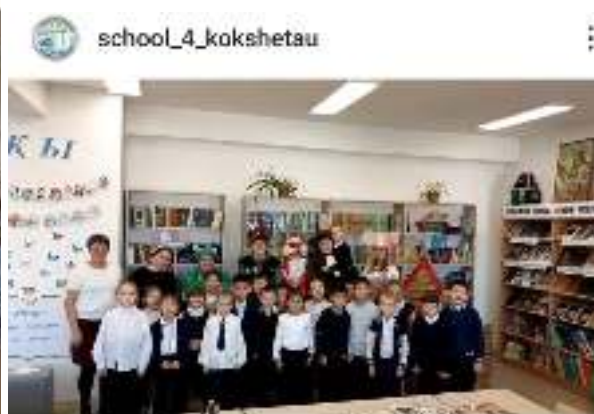
school_4_kokshetau По проекту 'Читающая школа' прошла инсценировка сказки 'Теремок' родителями 1 'Б' класса. #4мектепКокшетау #читающаяшкола Нравится madina7162kokshetau и ещё 30

https://www.instagram.com/reel/CyGdOaCsa0A/?igshid=ZjI0YTZmZTMwMg==