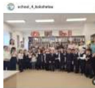
school_4_kokshetau 2023 ж. 19-класстын «Тыңау-күлтер мектеп» жобасы аясында 1107... Нравится madina7162kokshetau и ещё 21