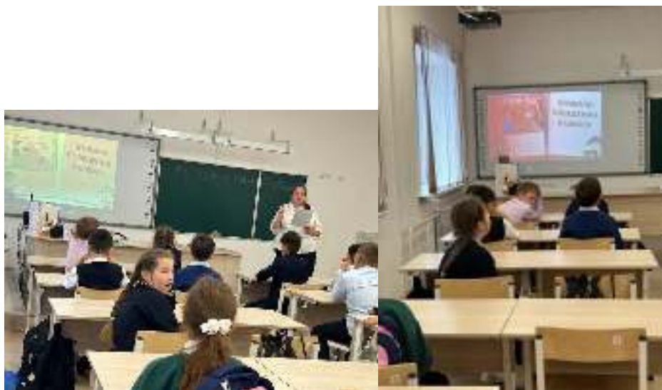
ФОТО и ссылки к классным часам .

1. https://www.instagram.com/p/Cyzddmgldjt/?utm_source=ig_web_copy_link&igshid=MzRIODBiNWFIZA